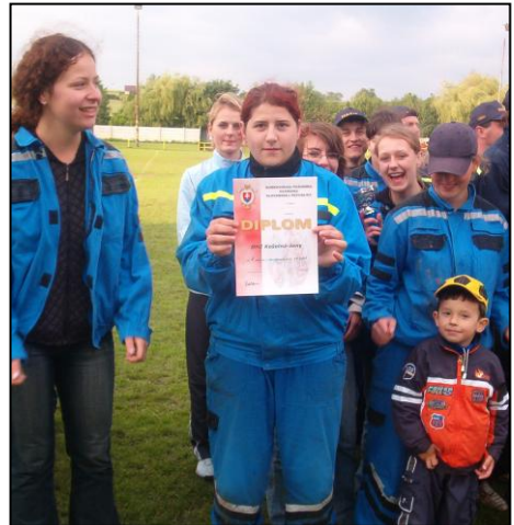
Okrsková previerka pripravenosti DHZ v Suhej nad Parnou 3.6.2006